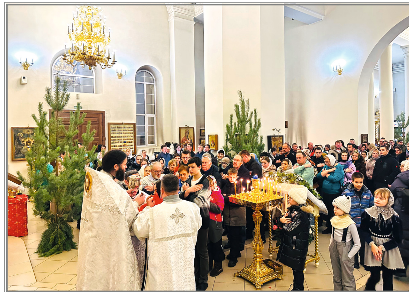
Рождественское ночное Богослужение

Святые отцы сравнивают церковь с кораблем, плывущим по бурному житейскому морю и перевозящим нас в Небесный Иерусалим. Именно таким духовным кораблем для нас является наш собор.