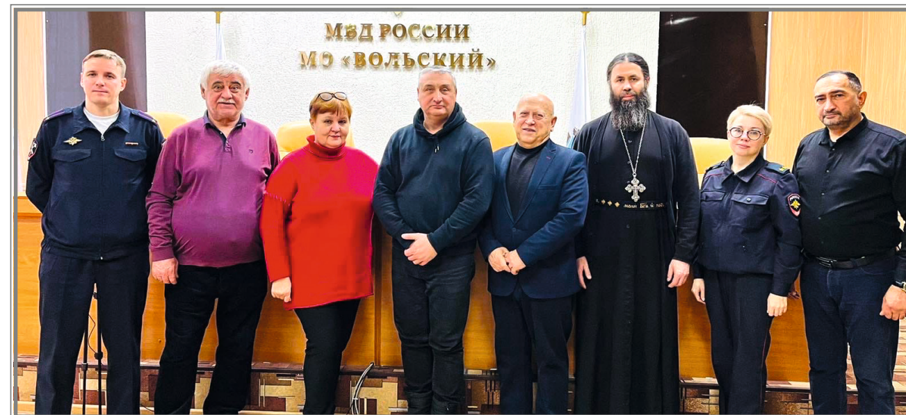
Общественный совет при МО МВД России «Вольский»

Священнослужители принимают активное участие в работе Общественной палаты Вольского муниципального района и Общественного совета при отделе МВД России в Вольском районе, взаимодействуют с Вольским военным институтом материального обеспечения, с 33-м Центральным научно-исследовательским испытательным институтом Министерства обороны Российской Федерации в г. Шиханы-2 и с Вольским отделением общественной организации ветеранов войн и конфликтов «Боевое братство».