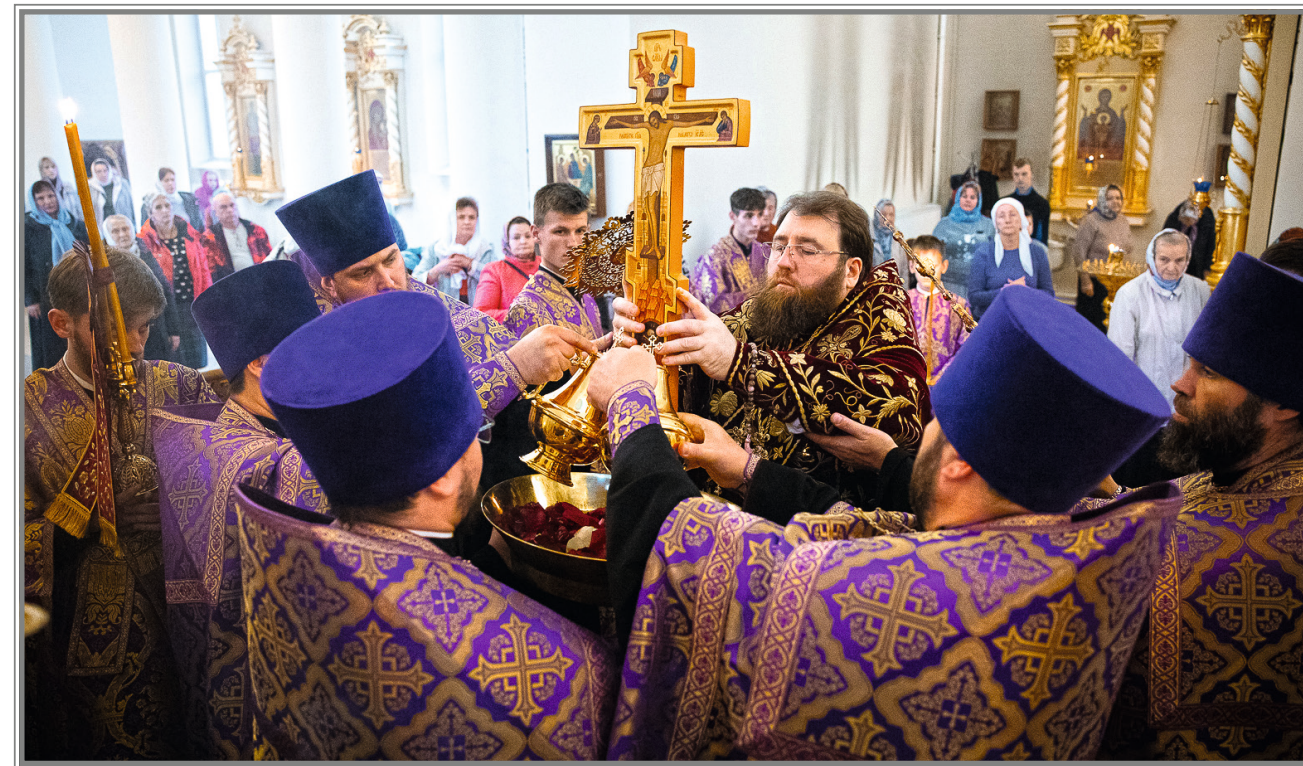
Воздвижение Креста Господня

В Священном Писании есть такие слова Господа: «Человекам это невозможно, Богу же все возможно» (Мф. 19, 26). Именно они приходят на ум, когда мы видим чудо возрождения нашего собора.