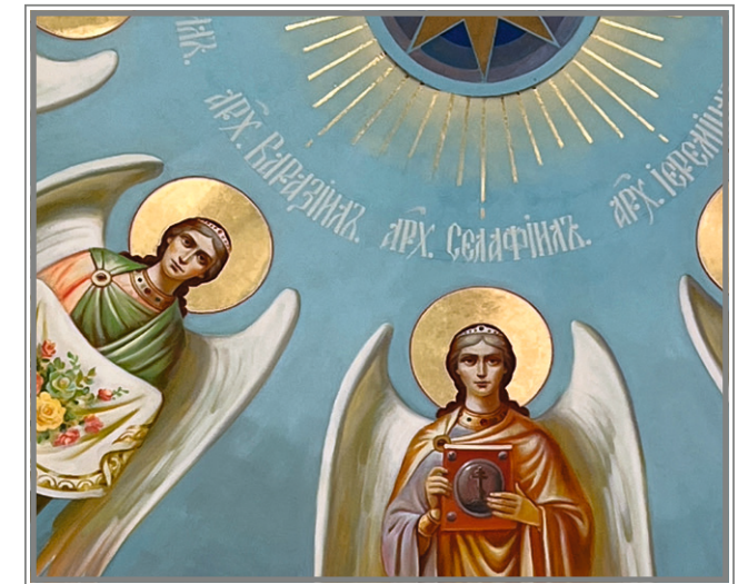
Фрагмент росписи купола собора

член-корреспондент Петровской академии наук и искусства. В 2016 году награжден серебряной медалью Союза художников России «Духовность. Традиции. Мастерство», в 2020-м за вклад в развитие культуры и искусства — «Знаком великого князя Андрея Боголюбского».