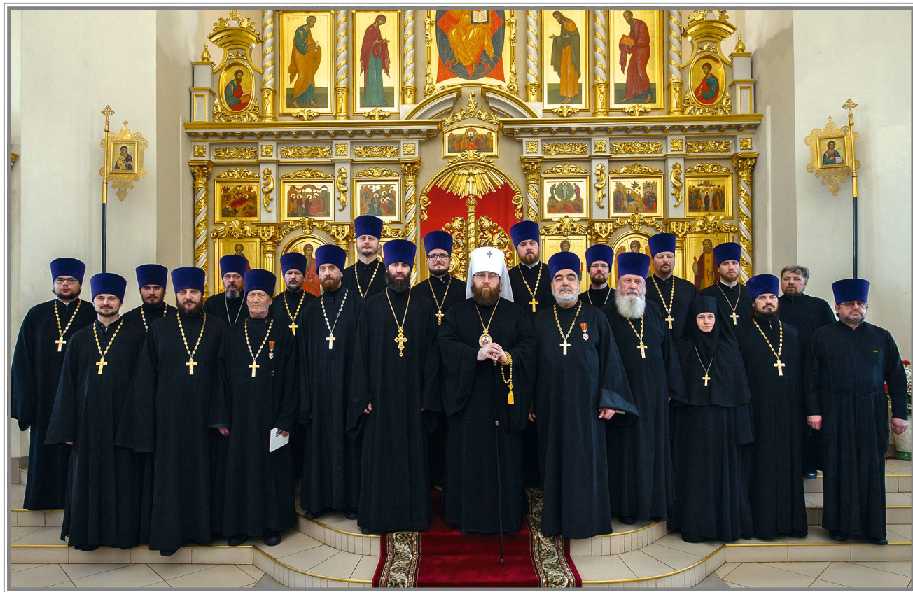
Духовенство Вольского благочиния после архиерейского богослужения

Но все же основным и наиболее важным в приходской жизни храма является проведение богослужений, совершение Таинств и обрядов.