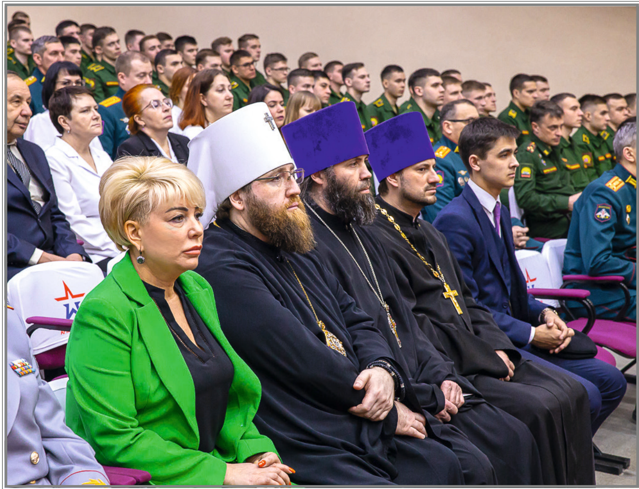
Юбилей в Вольском военном институте материального обеспечения (ВВИМО)