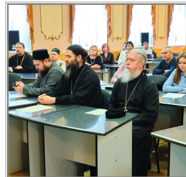
Совещание в администрации