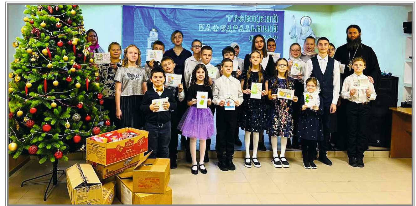
Письма и подарки на Рождество раненым бойцам в Шиханский госпиталь от воскресной школы