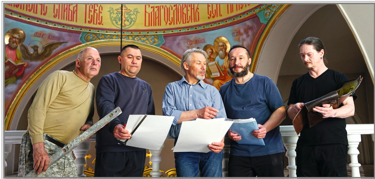
Команда иконописцев обсуждает дальнейшие работы по росписи

В 2023 году исполнилась многолетняя мечта всех прихожан Троицкого собора — началась роспись храма. Это очень большой и затратный проект.