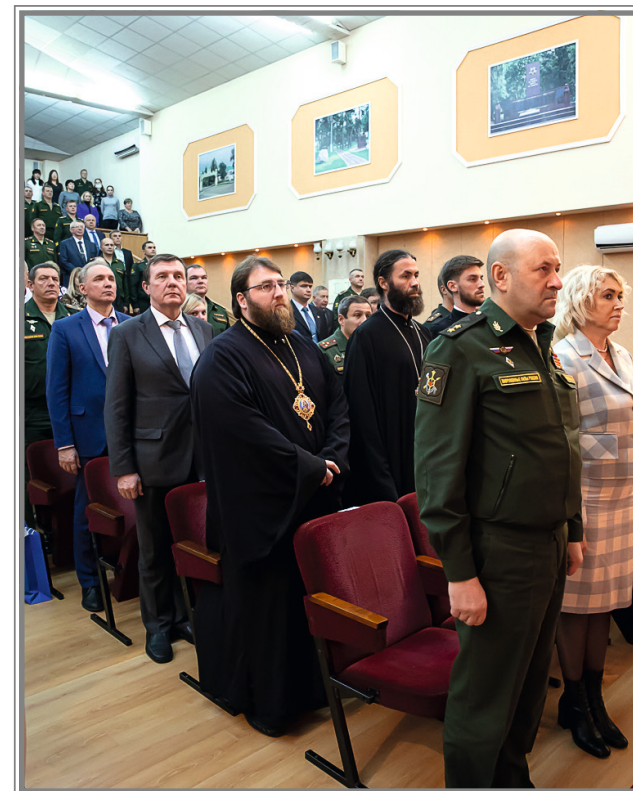
Юбилейные торжества по случаю 200-летия г. Шиханы