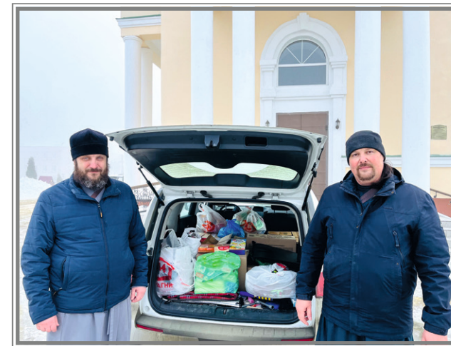
Отправка помощи в зону СВО