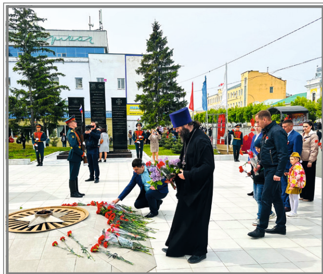
Возложение цветов в Праздник Победы к мемориалу Защитникам Отечества