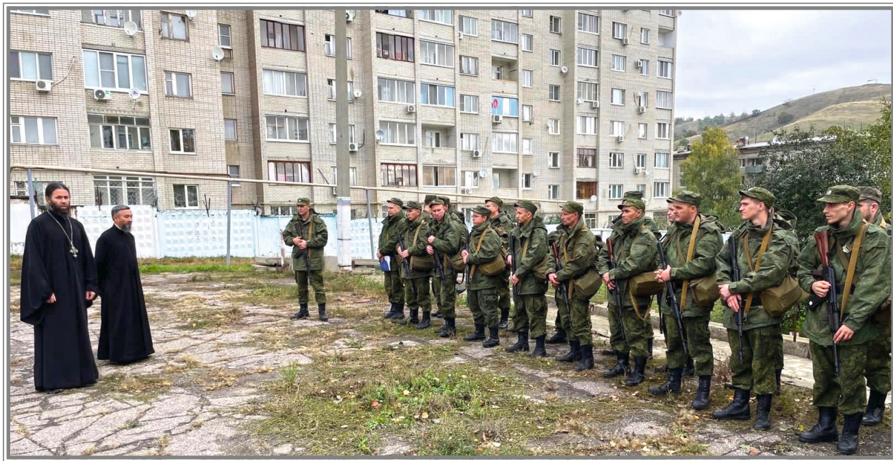
Беседы с мобилизованными

Важные события в жизни страны не оставляют равнодушными духовенство и прихожан собора. В зону проведения специальной военной операции направляются теплые вещи, портативные плитки, газовые баллончики, средства личной гигиены, вещи, лекарства, продукты, угощения. Прихожане собора принимают активное участие в плетении маскировочных сетей, изготовлении окопных свечей, иной волонтерской деятельности.