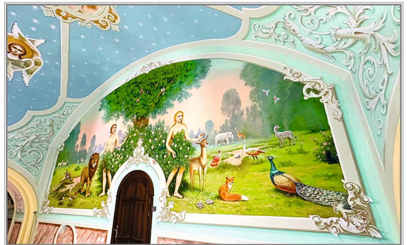
Фрагмент росписи на хорах собора. Райский сад