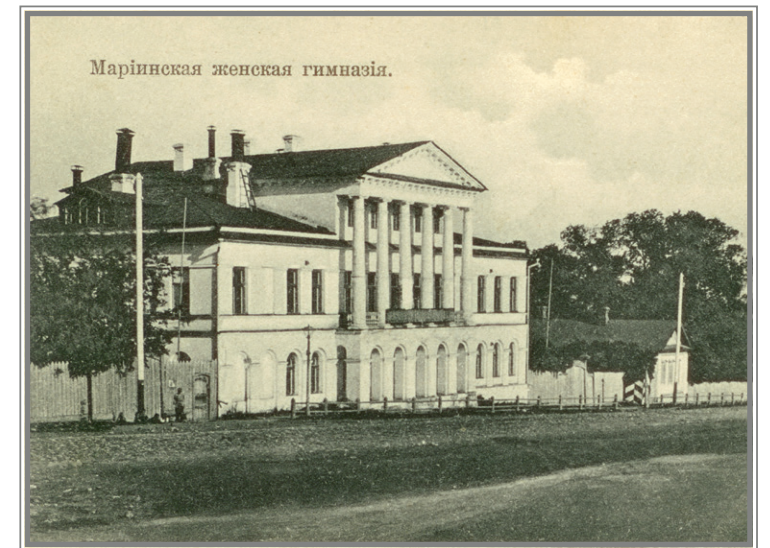
Вольская Марининская женская гимназия в разные годы своего существования