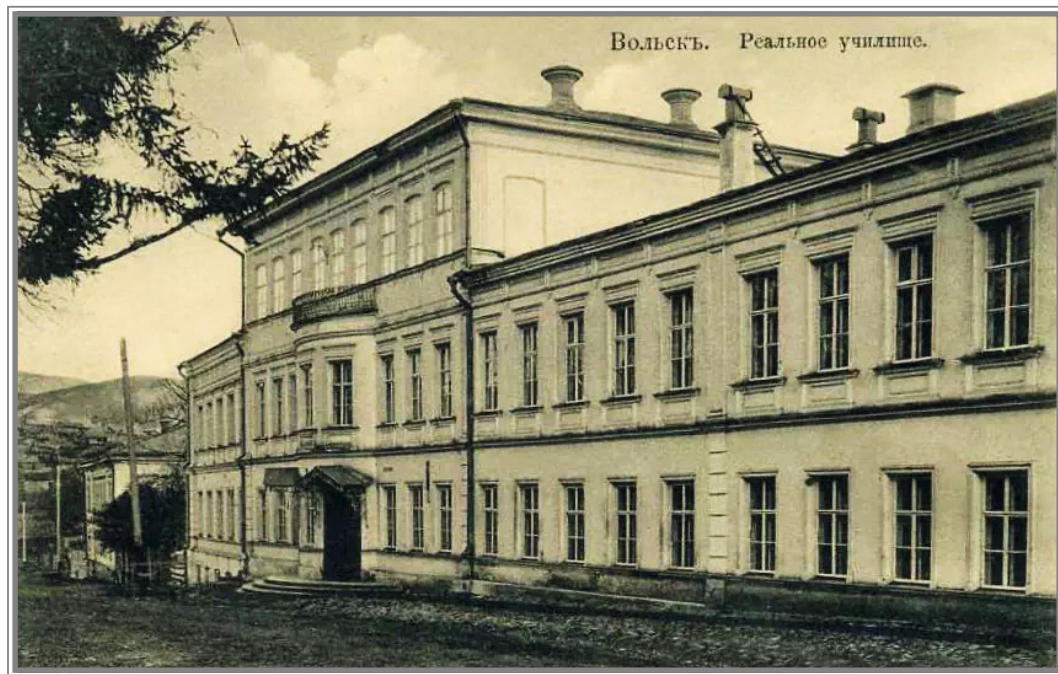
Вольское реальное училище. 1887 г.