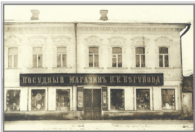
Посудный магазин П.Е. Бегунова