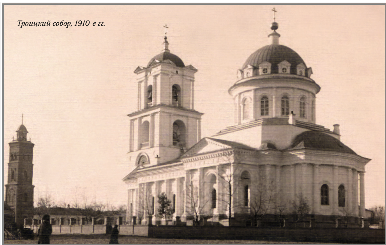
Троицкий собор, 1910-е гг.