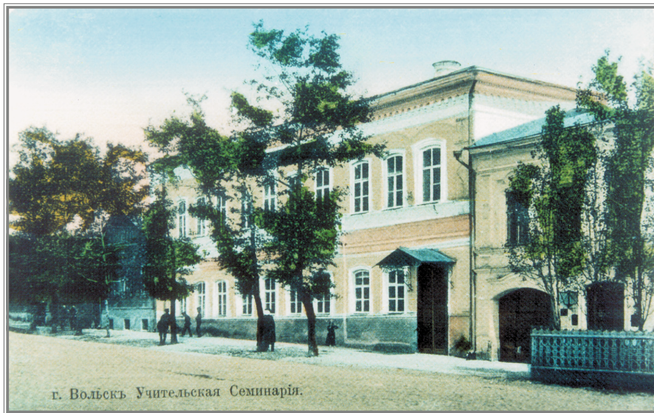
Вольская учительская семинария

Большинство учебных заведений содержалось за счет Государственной казны. Однако и город тратил на содержание учебных заведений немалую часть своего бюджета. При скудости казенных средств в деле народного просвещения особую роль играла традиционная для купеческого Вольска благотворительность.