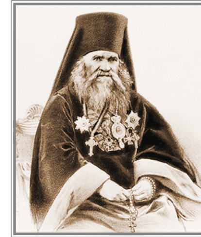
Епископ Антоний (Шокотов)

К административным своим обязанностям Преосвященный Антоний приступил весьма энергично. Трудно было не заметить, что для многих волгских старообрядцев единоверие было всего лишь формальной уступкой государственной власти. Принимая единоверие, вольские обыватели не становились от того чадами Греко-Российской Церкви. И уж совсем возмутительными были случаи, когда считавшиеся православными жители Волгска, вдруг изъявляли желание перейти в единоверие.