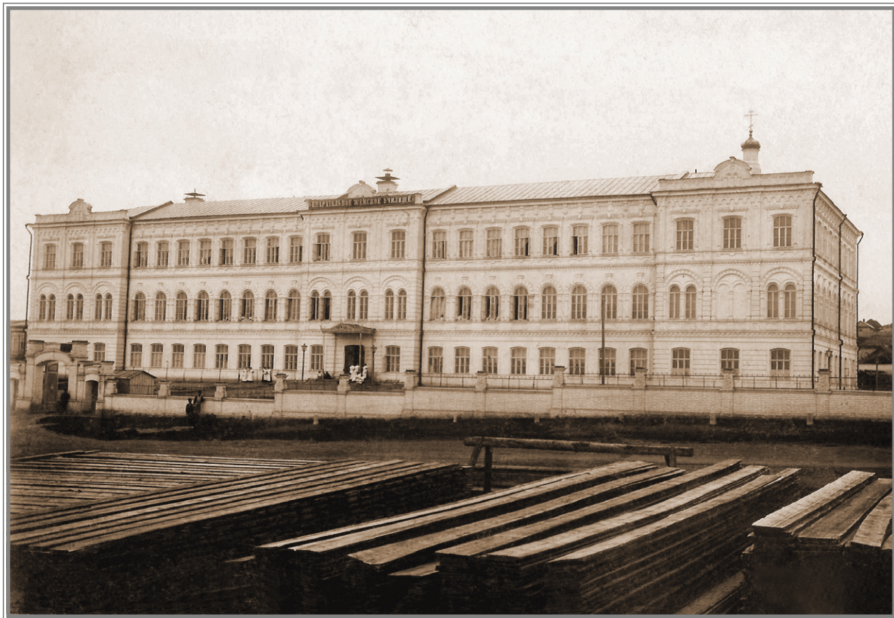
Второе Саратовское женское епархиальное училище

духовенства, которые при наличии минимальных способностей могли продолжить обучение в духовных семинариях. Училище разместилось в малопригодном для него особняке Л.И. Расторгуева, который после переезда в 1902 году учебного заведения в новое здание был сразу же разобран. В 1908 году в Вольское духовное училище были перемещены два первых класса Саратовской духовной семинарии. Домовый храм в новом здании ВДУ был освящен в память трех святителей — Василия Великого, Григория Богослова и Иоанна Златоуста.