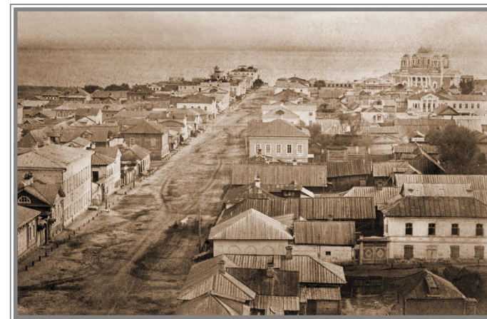
Московская улица. Вид Вольска. 1852 г.