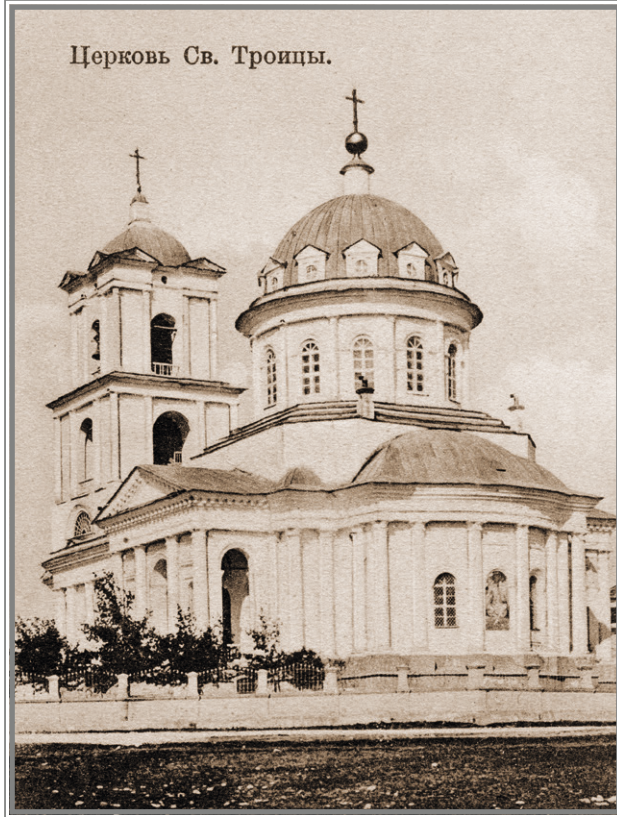
Троицкий собор. Открытка начала XX в.

ставлял меня о. Петр. Скажу только, что он действовал в деле моего спасения как истинный чадолюбивый пастырь. Он не жалел ни времени, ни сил для моего духовного назидания; всегда миролюбиво выслушивал мои возражения и с обычной кротостью отвечал на них. Слово Божие было у него единственным орудием к победе моего неверия... Если он видел, что я начинал гордиться происхождением от Израиля, то, обыкновенно, открывал такие места из Священного Писания, изреченные Духом Божиим об Израиле, что я краснел и вздыхал, не зная, что отвечать на такие слова.