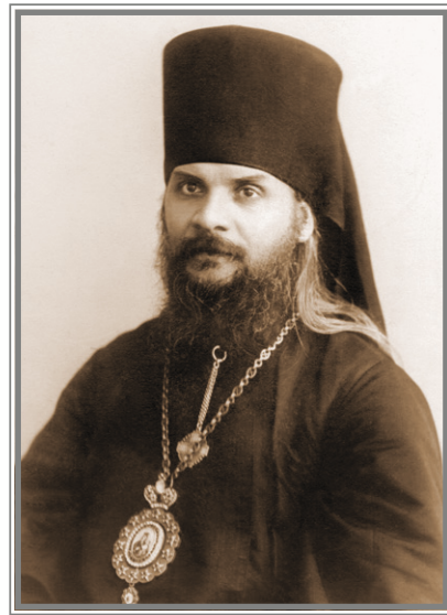
Священномученик епископ Гермоген (Долганёв). Из альбома 1-го Саратовского епархиального училища за 1906 г.

После литургии и молебна перед святым образом, отслуженным вместе с Вольским викарным епископом Досифеем и собором городского духовенства, епископы Гермоген и Досифей отправились в Казань и далее в Седмиезерную пустынь, место по-