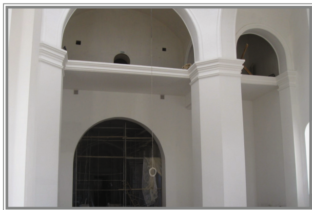
Внутренняя и фасадная отделка. Весна 2009 г.