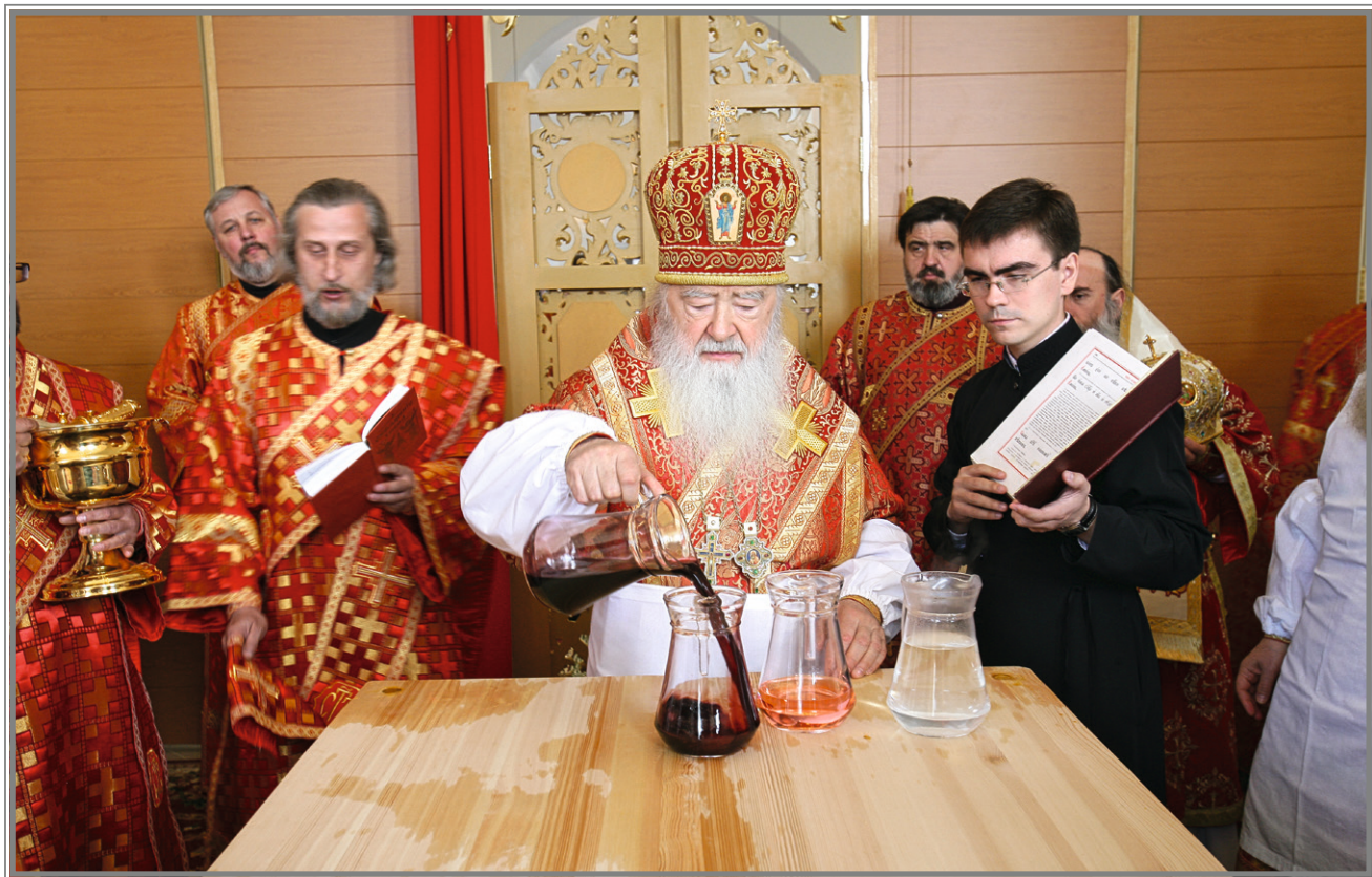
Освящение Троицкого собора 23 мая 2009 г.

90 Старейшая площадь города, место, где стояла первая православная церковь Вольска, украсилась новым храмом. Его облик наделяет духовным оптимизмом каждого горожанина, неравнодушного к судьбе своего Отечества. И главная