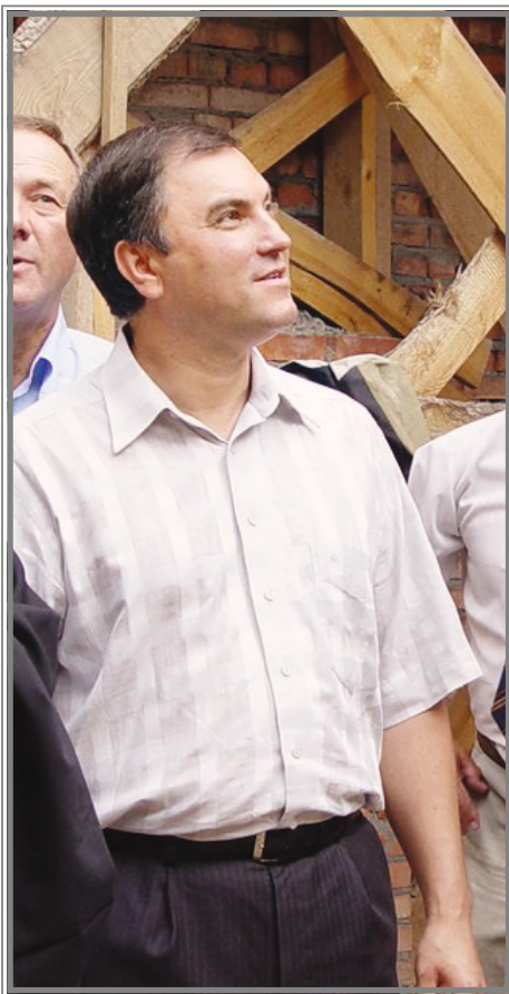
Рабочий визит депутата Государственной Думы РФ В.В. Володина. 2007 г.