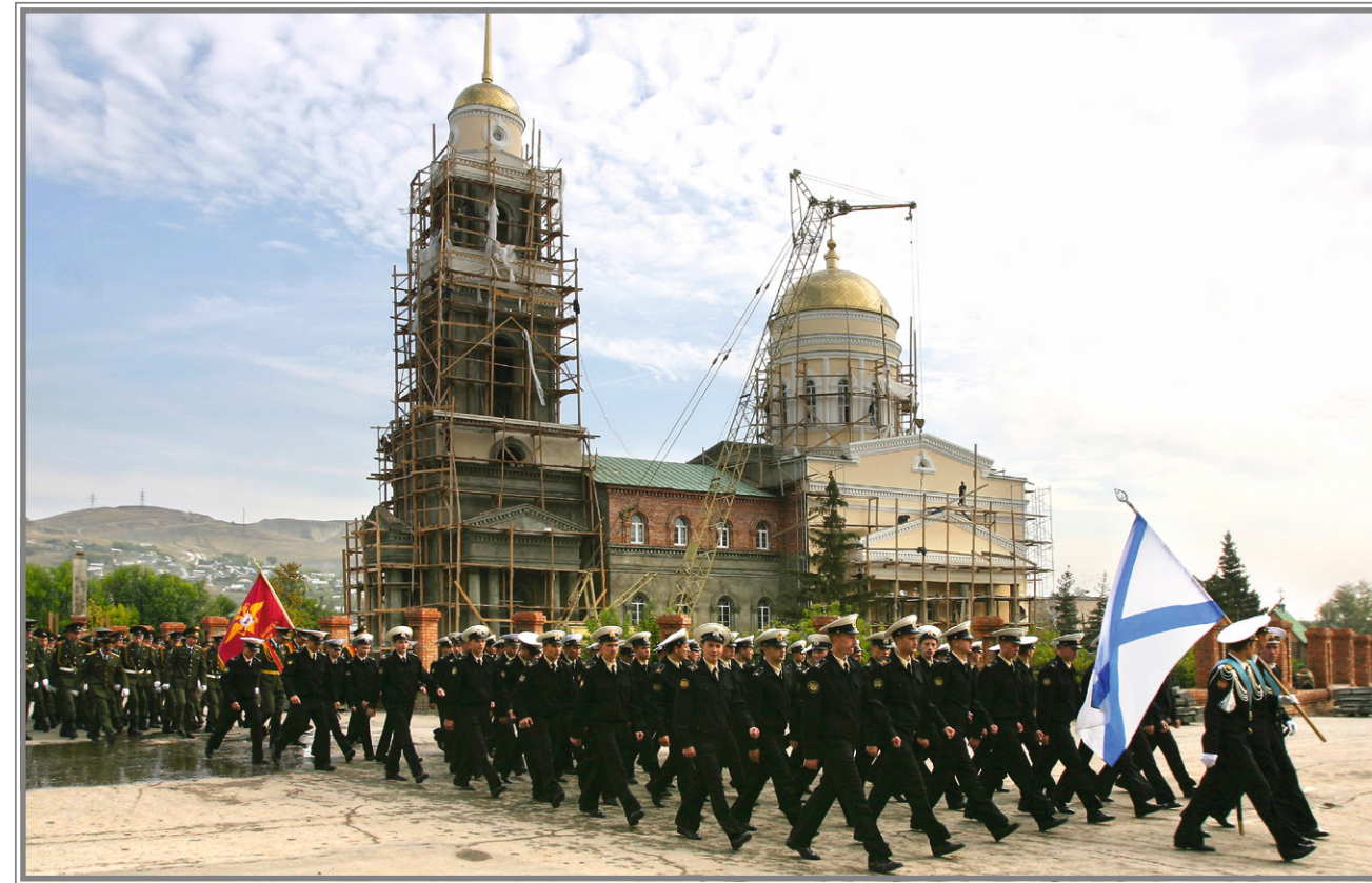
Курсанты ВВИМО идут на Парад Победы мимо строящегося собора